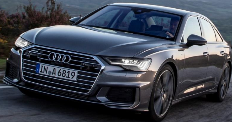
Abbildung zeigt Fahrzeug des Produktionsjahrs 2018 mit optionaler Sonderausstattung

* Audi A6 Limousine 50 TDI quattro tiptronic, 210 kW: Kraftstoffverbrauch kombiniert: 6,1-5,9 l/100 km (NEFZ) bzw. 6,9-6,3 l/100 km (WLTP) ; CO 2 -Emissionen kombiniert: 162-155 g/km (NEFZ) bzw. 181-164 g/km (WLTP)